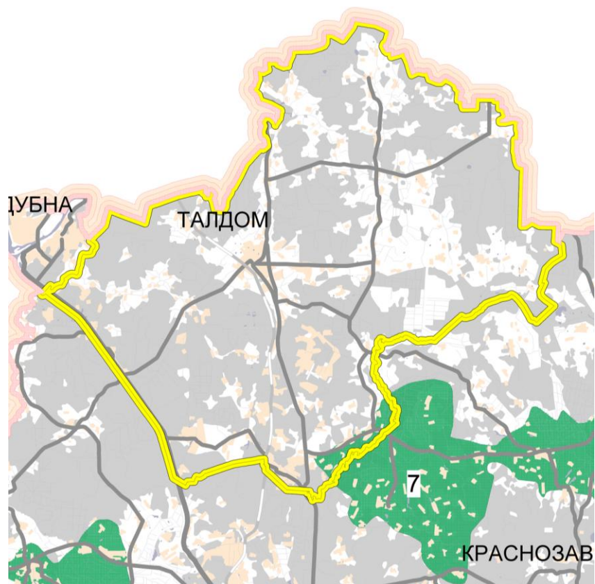
Рисунок 2.8.1. Фрагмент карты (схемы) планируемых особо охраняемых территорий – природных экологических территорий из Схемы территориального планирования Московской области – основных положений градостроительного развития

В соответствии с Законом Московской области от 07.03.2007 № 36/2007-ОЗ «О Генеральном плане развития Московской области», образование системы особо охраняемых природных территорий областного значения, а также природных экологических территорий для создания необходимых условий сохранения, восстановления, реабилитации и использования природных территорий Московской области предусматривается на основе выполнения следующих условий: