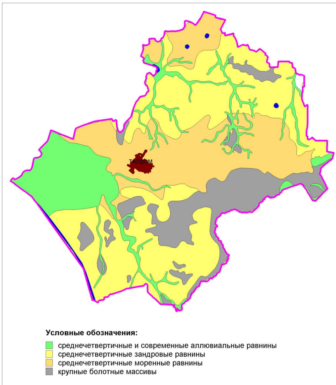
Рис 1. Обобщенная геолого-геоморфологическая схема территории Талдомского городского округа.

и возвышается над поймой на 15-20 м. поверхность плоская, переход к водоразделу или 3-й террасе, как правило, выражен. 1-я терраса развита участками. Высота над урезом колеблется от 6-7 до 9-15 м, поверхность ее плоская, часто осложненная прирусловыми валами высотой до 2,5 м. Пойма в пределах долин Дубны и Сестры формирует 2 высотных уровня: высокий (5-10 м) и низкий (0,7-3 м), на остальных реках одноуровневые поймы высотой от 1 до 4 метров. На пойме многочисленны старичные озера и прирусловые валы высотой до 3 метров. Поверхность поймы плоская (уклоны менее 0,5 %), почти повсеместно заболоченная.